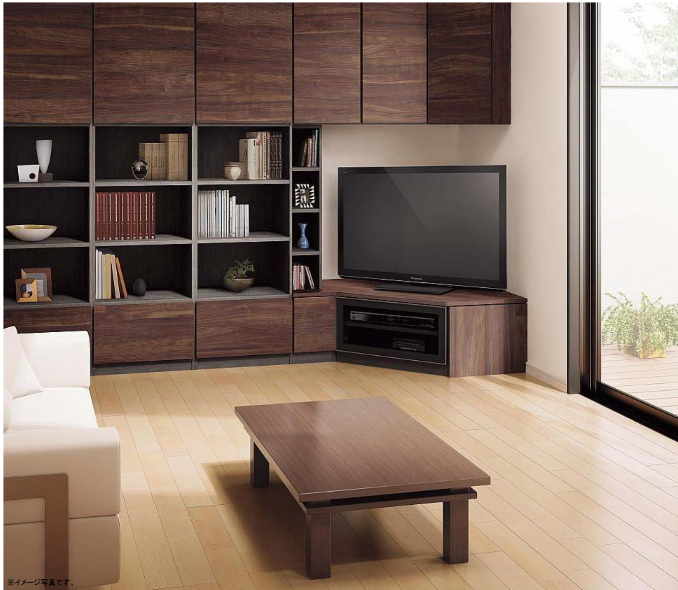
※イメージ写真です。