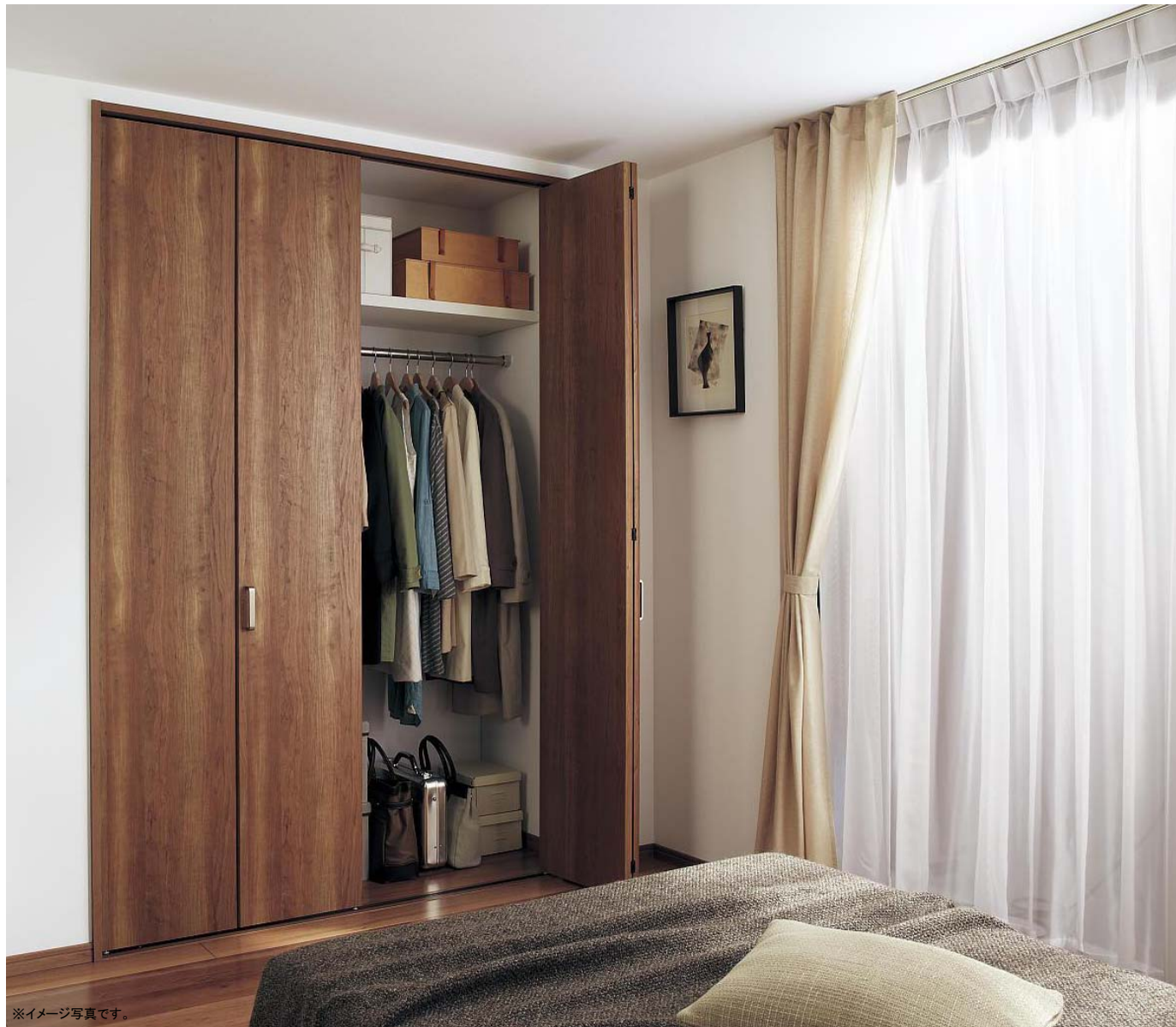
※イメージ写真です。