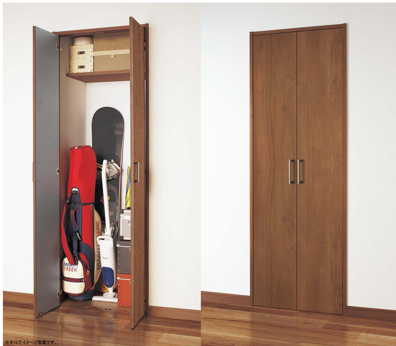
※すべてイメージ写真です。